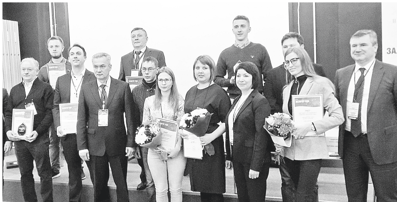
Победители и призёры регионального конкурса «Экспортёр года»

Управление информационной политики Администрации губернатора Новгородской области.