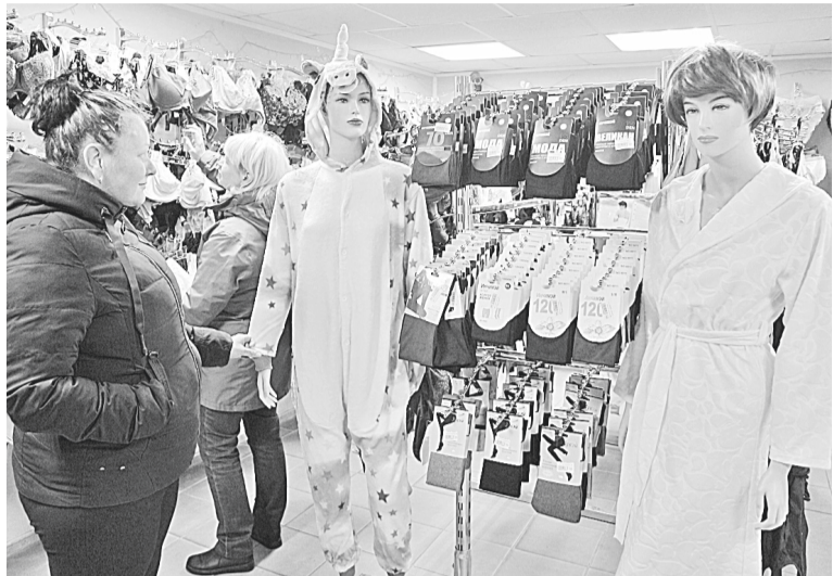
В магазине «Людмила» — богатый выбор нижнего белья и новое поступление турецкого трикотажа (2-й зал)

Вот уже который год один из самых женских магазинов города проводит новогодний розыгрыш призов. Подарки, как всегда, отличные — комплекты постельного и нижнего белья, сертификат на ужин в ресторане «Антонио», пластиковое окно.