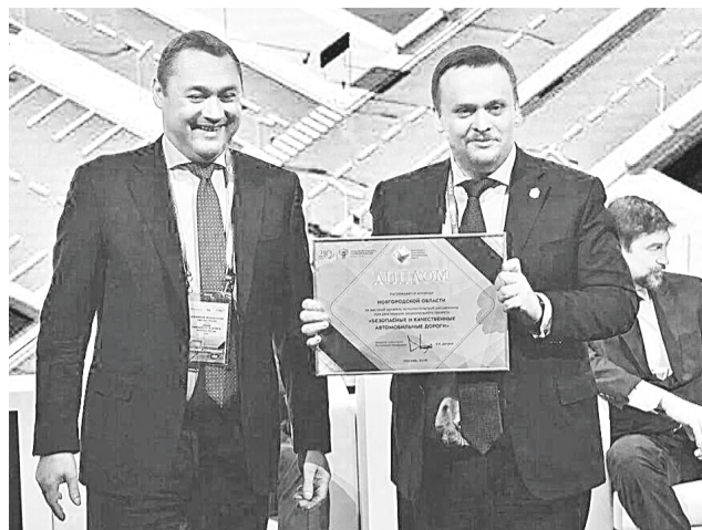
Вручение диплома Министерства транспорта РФ губернатору Андрею Никитину — за эффективную реализацию нацпроекта «Безопасные и качественные автомобильные дороги»